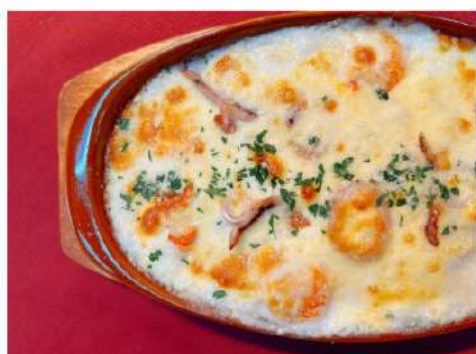
シーフードグラタン