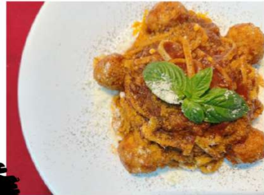
ミートボールパスタ